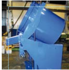
Sabaf Ospitaletto (BS)