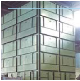
Rafmetal Casto (BS)