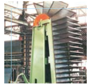
Fondital Vestone (BS)