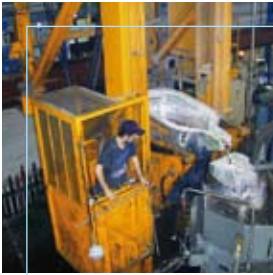
Fondital Vestone (BS)