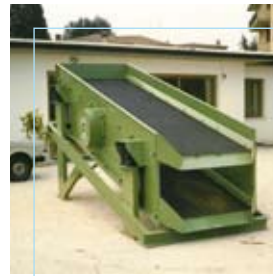
Rafmetal Casto (BS)