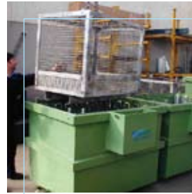
Ghial Castegnato (BS)