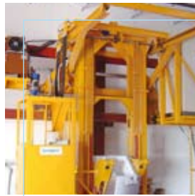
Alucofer Albacete - Espagne