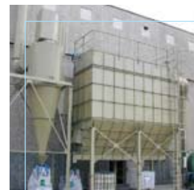
Radiatori 2000 Ciserano (BG)