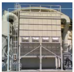
Pasotti Prevalle (BS)