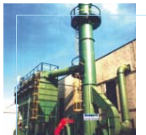
Sk Wellman Orzinuovi (BS)