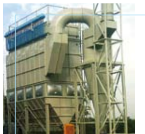
Radiatori 2000 Ciserano (BG)