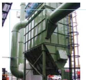
Sk Wellman Orzinuovi (BS)